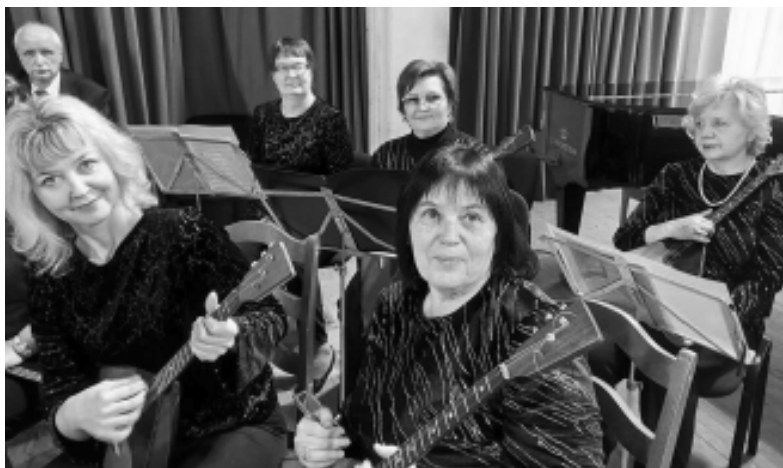
В этом уникальном коллективе все музыканты являются преподавателями Ярцевской школы искусств

Мероприятие проводилось в форме гала-концерта, и в нем